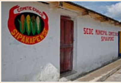
Foto-essay over de verkiezingen in Sipakapa

Elke vier jaar houden de verkiezingen de aandacht van miljoenen mensen gevangen, en steeds opnieuw is de teleurstelling groot. In dit verkiezingsjaar richtte de media haar aandacht op exotische presidentskandidaten als een ex-generaal die beschuldigd wordt van mensenrechtenschendingen, een Nobelprijswinnares die behalve vrouw ook indiaanse is, een ex-guerrillacommandant, een gehandicapte ondernemer en de gebruikelijke kandidaten van de elite. In totaal meer dan een dozijn. Hier in Guatemala spelen echter ook lokale machtsstructuren een belangrijke rol, vooral in plattelandsgemeenschappen. De gemeentelijke verkiezingen worden dan ook hard bevochten. In Sipakapa hebben de mensen die de taaië strijd tegen onrechtvaardige en destructieve mijnbouwpraktijken hebben geleid zich verenigd in een zogeheten Comité Cívico, om zo te proberen politieke macht te krijgen. Het foto-essay geeft een beeld van sleutelmomenten gedurende de laatste 48 uur van de verkiezingsstrijd, gezien door de ogen van het Comité en de bevolking van Sipakapa.